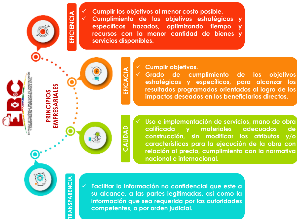
Gráfico N° 1 Principios Empresariales

La EBC, se enmarca en los siguientes principios empresariales: